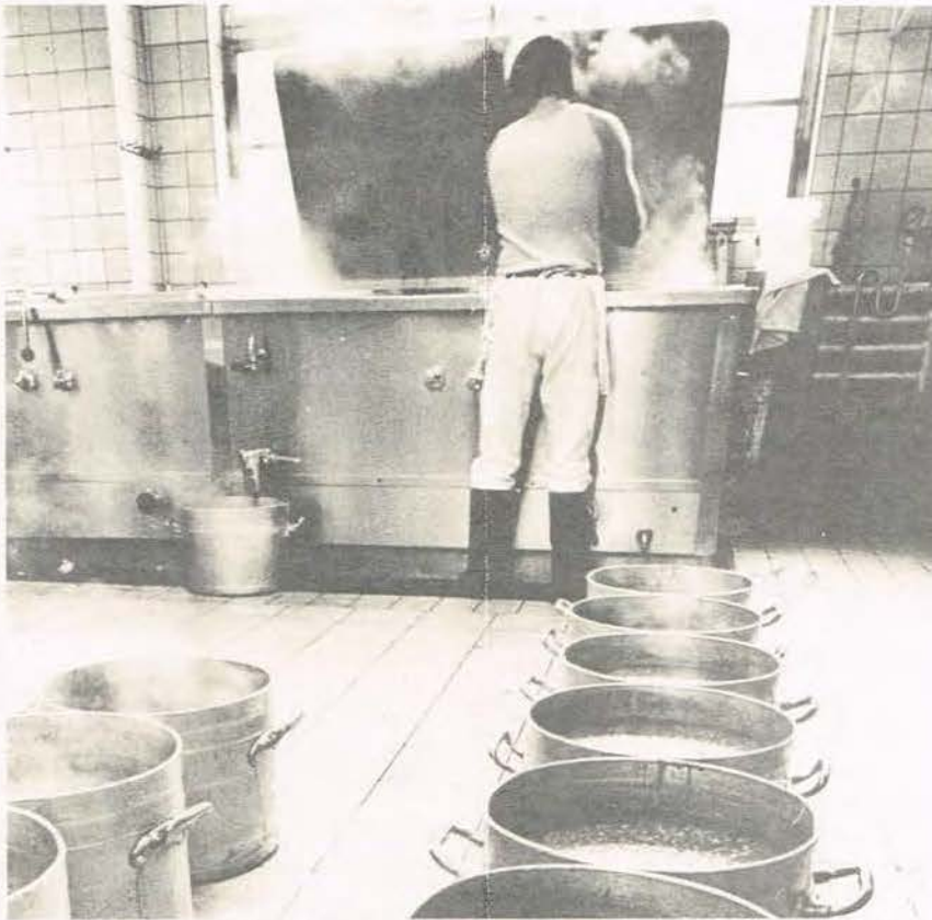
Eintopf wird in der Gefängnisküche am liebsten gekocht: Das ist leicht zu machen und gut auszuteilen. Einfach praktisch. Was fehlt, ist der passende Einheitsgeschmack der Häftlinge.

Selbst unter den besten denkbaren Voraussetzungen fehlt der Bezug zur Realität, ohne den Resozialisierung nicht möglich ist. So ist der durch Gesetz geregelte Einsatz von Sozialurlaub und gelegentli-